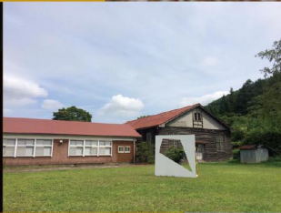
qualia / 主観的な経験にもとづく独特の質感 2015