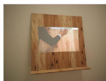
《つかみえぬ空虚な実体／触覚》 ACT / quality 2015 ©Takuma Ikeda