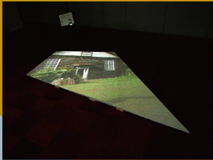
destruktion / 解体 2015