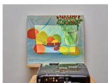
《作者不明のじかん／剥離》 ACT / quality 2015 ©Takuma Ikeda