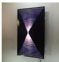
《ある行為の出力と入力》 ACT / effect 2015 ©Takuma Ikeda photo by Ayumi Matsuura

1983年神奈川県生まれ。2009年東京芸術大学大学院美術研究科油画専攻修了、主な個展に2015年「つかみえぬ空虚な実体／触覚」タカシソメミヤギャラリー、2016年「けされる絵／描かれるじかん」八戸ポータルミュージアムはっち、など。「取手アートプロジェクト2006」茨城、「群馬青年ビエンナーレ」2012、2015入選、などの展覧会へ参加。