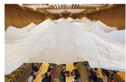
山のようなもの (WS) [2017]