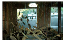
間 - liminal / subliminal - [2014]