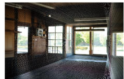
堆積した埃の層に夢を見る [2014]