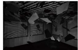
乖 - Quai - [2013]