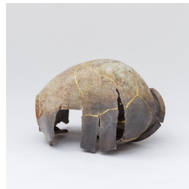
図版11 村田森《破れ壺》2013 90×65×48cm Shin Murata 陶芸家。1970年京都府生まれ、同地在住。