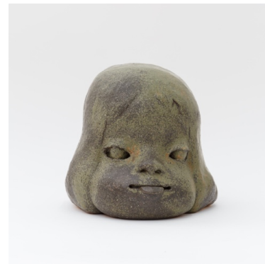
図版8 奈良美智《舌出しの子》2010 28×37×28cm ©Yoshitomo Nara Yoshitomo Nara 美術家。1959年青森県生まれ。