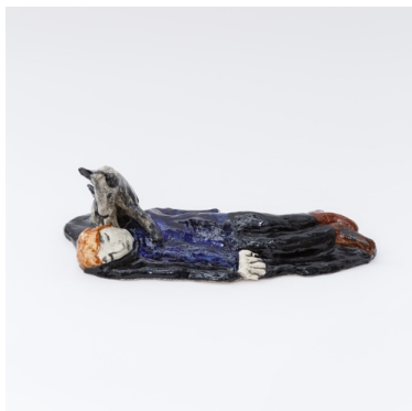
図版6 クララ・クリスタローヴァ 《犬と、眠る》2010 48×16×24cm ©Klara Kristalova, Courtesy of Galerie Perrotin Klara Kristalova 美術家。1967年ブラハ(旧チェコスロヴァキア) 生まれ、スウェーデン在住。