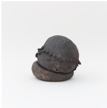
図版4 大谷工作室《寝る子》2016 40×36×33cm Otani Workshop 美術家。1980年滋賀県生まれ、同地在住。