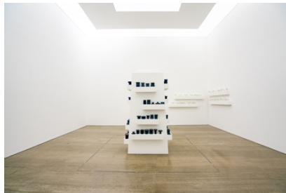
《Porcelain Tower》2021-2022年 磁器・木・石英砂、サイズ可変