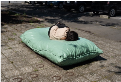
《Mark in the Space》2010年、FRP 240×125×50 cm ※十和田市現代美術館 常設展示作品