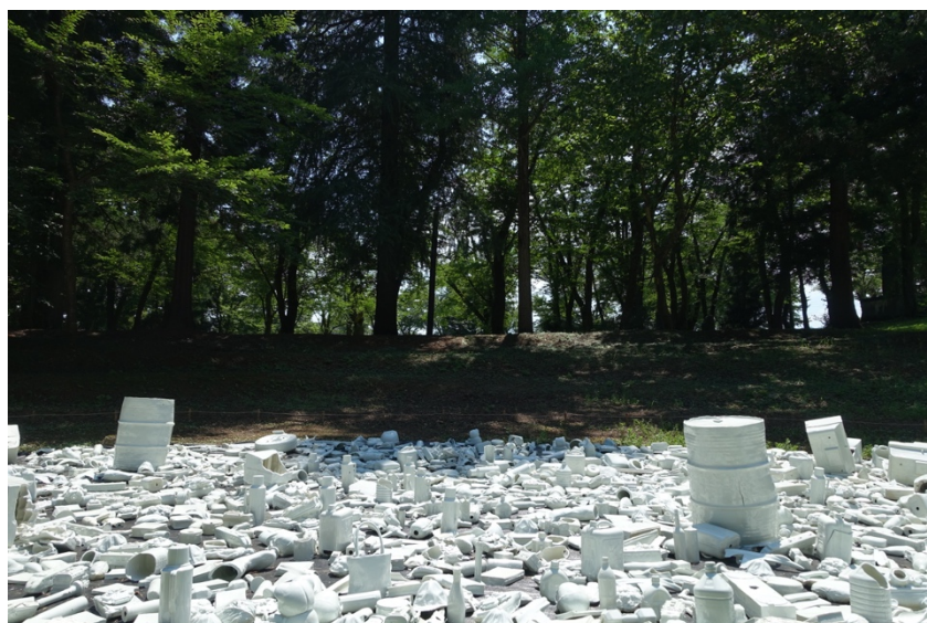
《Discard》2001-2015年、磁器、サイズ可変