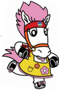
⑥ 地域交流センター(とわふる) Towada Regional Exchange Center