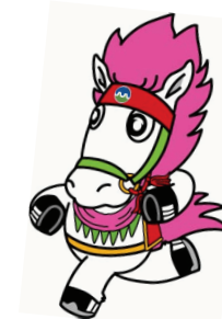
⑨ 市民図書館 Towada City Library