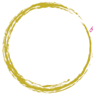
⑤ 花真 Hanashin

Let's find art and stamps around Towada! Visit our local spots and collect unique stamps. When you collect 5 or more stamps, you can get a discount on drinks at the museum's cafe, Cube.