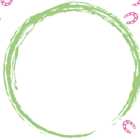
① 十和田観光物産センター Towada tourism & products center