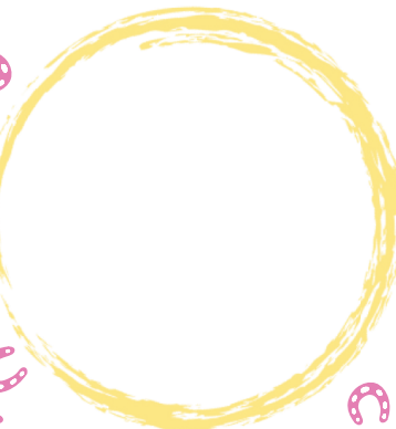
② 松本茶舗 Matsumotochaho