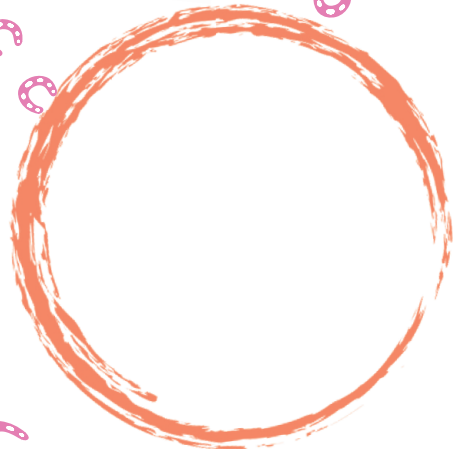
③ 高村食料品店 Takamura Grocery