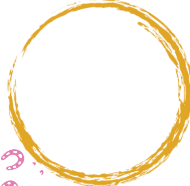
⑧ サンバスタンド Sanba Stand